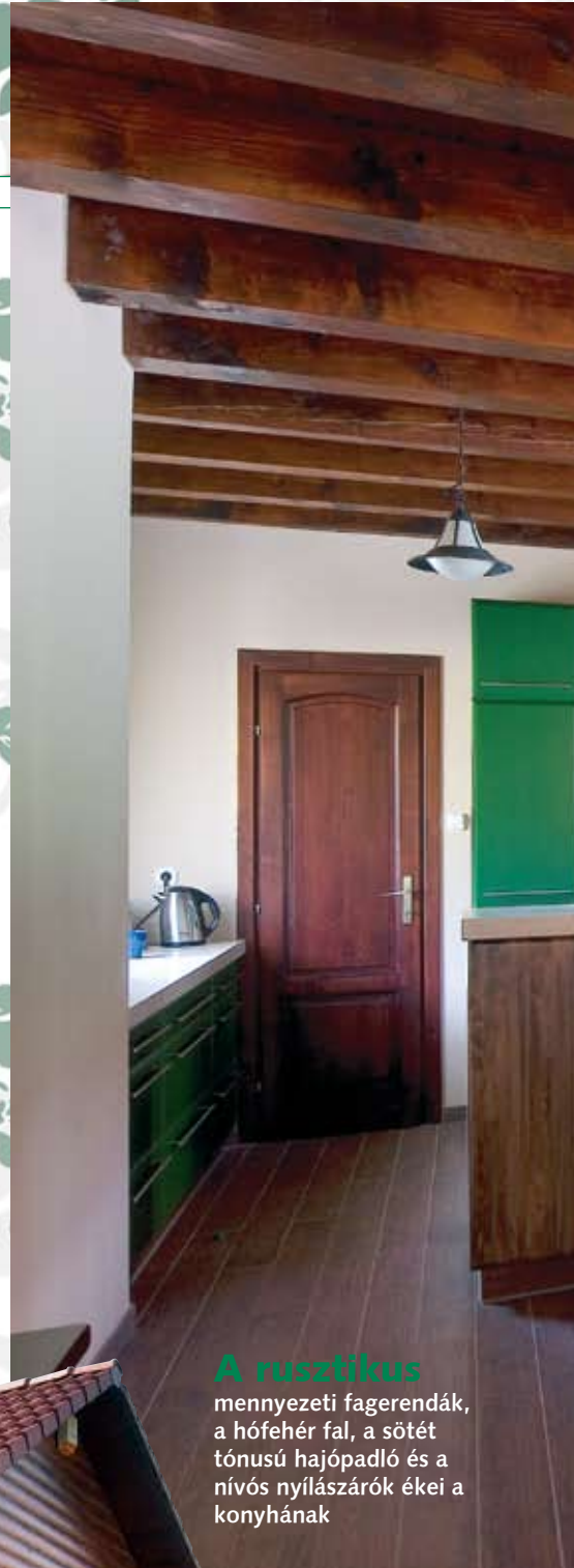
A rusztikus mennyezeti fagerendák, a hófehér fal, a sötét tónusú hajópadló és a nívós nyílászárók ékei a konyhának