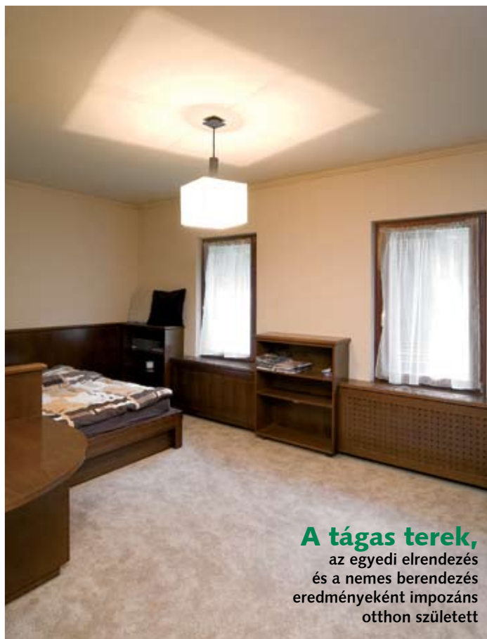
A tágas terek, az egyedi elrendezés és a nemes berendezés eredményeként impozáns otthon született